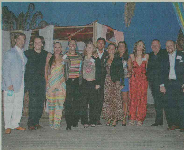
Lo staff dell'Adriatic Air cargo di Riccione

I successi della società di spedizioni e trasporti